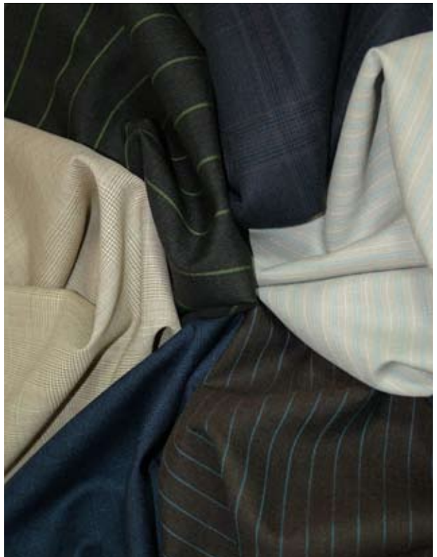
HS 129 SNOWY RIVER - 368000'S

Comfort, aspetto e prestazioni sono migliori grazie all'uniformità delle fibre e i capi mantengono la forma e durano più a lungo.