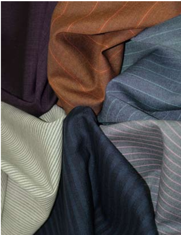
HS 119 ENGLISH MOHAIRS - 288000'S